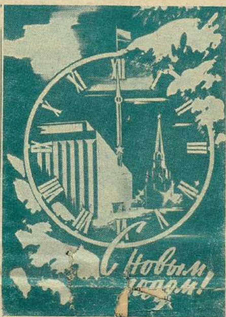
ПЛАКАТ ХУДОЖНИКА В. ВИКТОРОВА. ИЗДАТЕЛЬСТВО «ПЛАКАТ».

Трудовые коллективы района имеют все возможности, используя хорошую основу, созданную в 1982 году для производительной, ритмичной работы в третьем, сердцевином году одиннадцатой пятилетки, успешно выполнив решения XXVI съезда КПСС, майского и ноябрьского (1982 г.) пленумов ЦК КПСС.